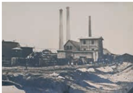
Paraffinfabrik Bunge & Corte

Der „Heimat- und Bergbauverein der Seegemeinden. Röblingen am See e.V.“ lädt alle Mitglieder und Interessenten ganz herzlich zur Einweihung einer neuen „Historischen Orte-Tafel“ am 18.04.2026 um 11.30 Uhr in der Frankestraße gegenüber Haus Nummer 14 ein.