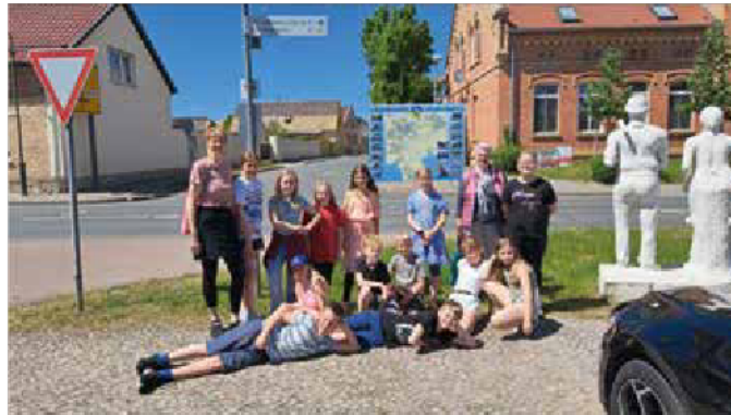
4. Klasse am 14. Mai 2024