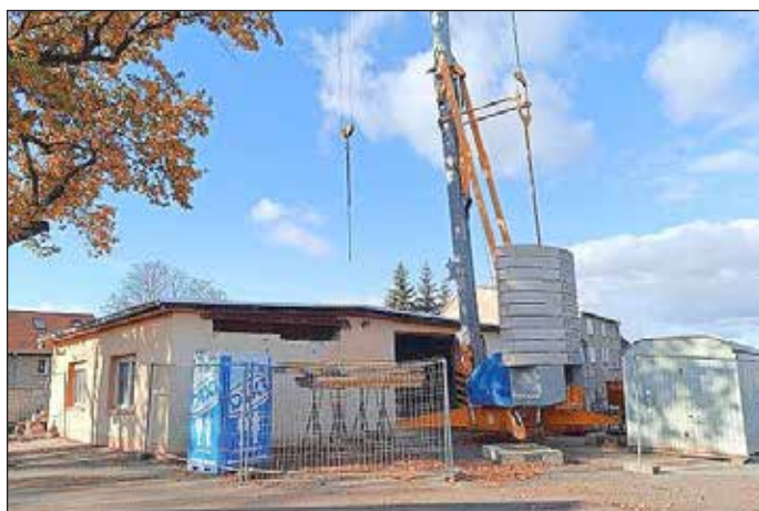
Um- und Ausbau des Feuerwehrgerätehauses in Stedten