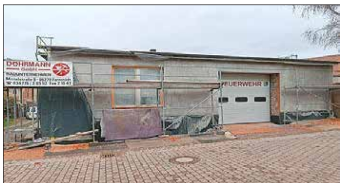
Fassadensanierung am Feuerwehrgerätehaus in Aseleben