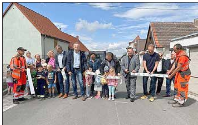
Übergabe der Kreisstraße einschließlich Nebenanlagen in Seeburg

Trotz der nach wie vor äußerst schwierigen Finanzlage unserer Kommune, erreichten wir in den vergangenen Monaten erneut viel. So konnten Ratsbeschlüsse abgearbeitet werden, welche insbesondere die Erhaltung und Verbesserung der gemeindlichen Infrastruktur zum Inhalt hatten. Spielplätze wurden neu gebaut, ruinöse Gebäude abgerissen und Plätze neu gestaltet, Dorfgemeinschaftshäuser in den Ortsteilen saniert und auch in die Grundschulen wurde weiter investiert.