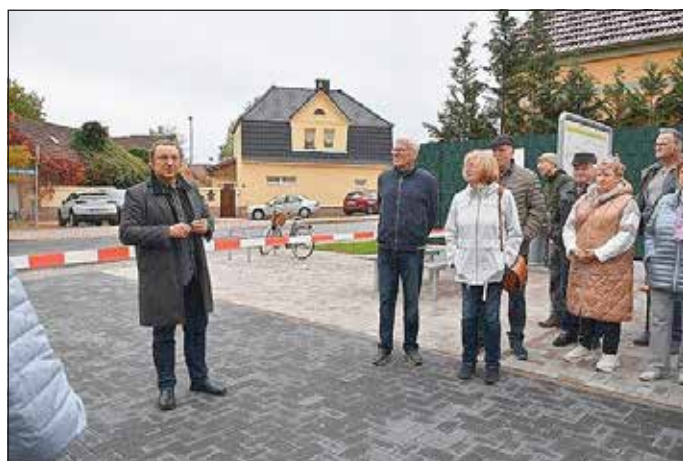
Eröffnung des neugestalteten Platzes in Unterröblingen nach Rückbau ruinöser Gebäude