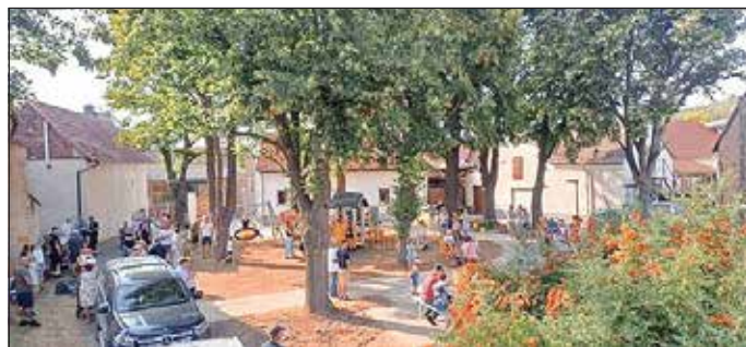
Einweihung des neuen Spielplatzes in Wormsleben