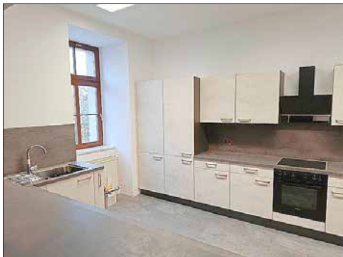
Neue Kücheneinrichtung im Bürgerhaus Erdeborn

Eine große Herausforderung für die kommenden Jahre wird natürlich die Umgestaltung der Uferpromenade und des Wirtschaftshofes am Schloss Seeburg sein und wir freuen uns darauf. Ebenso schreiten die Planungen für den Rad- und Wirtschaftsweg zwischen Aseleben und Röblingen voran. All das zeigt, wir investieren weiterhin unter der optimalen Nutzung der Fördermittel von Bund, Land und EU, um so die Investitionskraft der Kommune zu stärken.