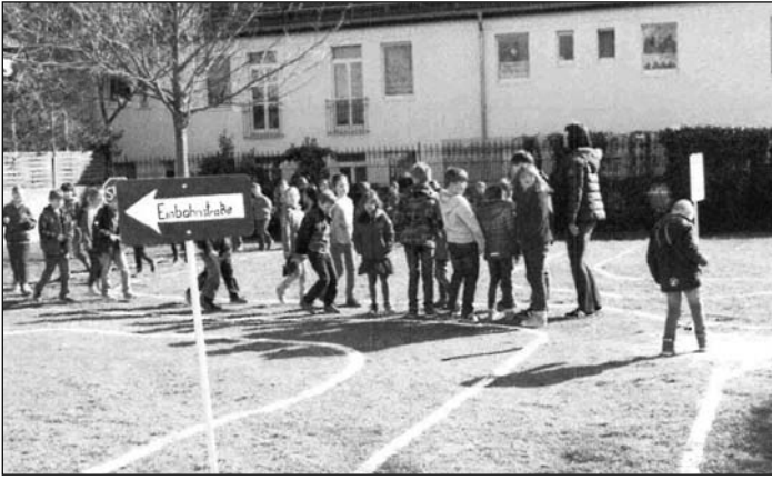
Die Kinder laufen ihren neuen Verkehrsgarten zunächst ab, um die Verkehrsschilder kennenzulernen und zu besprechen.