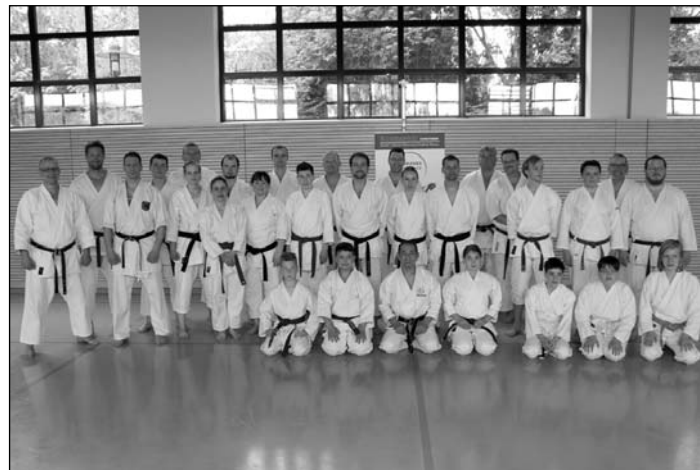
Alle Lehrgansteilnehmer (oben) und die KUSHANKU's (unten)