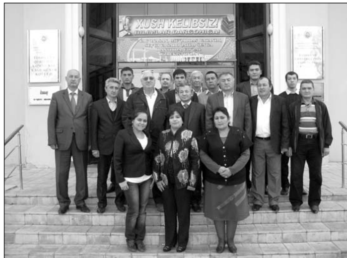
Lehrgangsteilnehmer vor dem „Berufskolleg für Bau- und Kommunale Wirtschaft“ in Taschkent.

Natürlich gab es auch jede Menge Fragen zu Deutschland und zu meiner Heimat, Röblingen am See, im Seegebiet. Zu Röblingen, dem Seegebiet und zum Leben in Deutschland konnte ich zu jeder Zeit berichten. In weiser Voraussicht hatte ich Informationsmaterialien zum Seegebiet, zu den Lutherstädten Eisleben und Mansfeld, zu Luther und Halle, in Form von Broschüren,