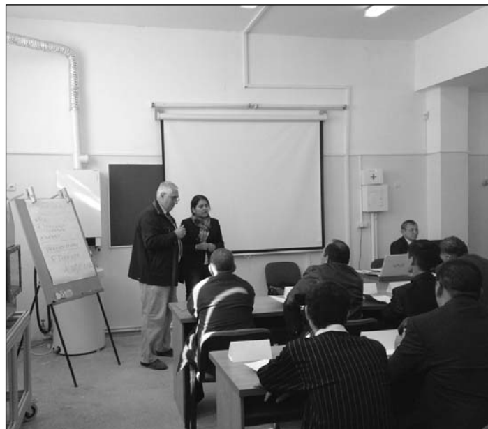
Arbeit im Trainingsraum.

Büchern und Flyern mitgenommen. Diese habe ich dann als Geschenke weitergegeben und dafür viele Dankesworte und vergleichende Informationen zu Usbekistan erhalten.