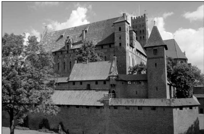
Die Marienburg am Ufer der Nogat – die größte Ziegelburg der Welt.

Malerische Sonnenuntergänge, naturbelassener Ostseestrand, eine altehrwürdige Hansestadt und weitere historisch bedeutende Kulturgüter z.B. die Marienburg – natürlich auch fundiertes Training bei einem altbewährtem Trainerteam, Spiel, Spaß und jede Menge Action, alles das machte die Reise für die »KUSHANKU's« nach Polen auch in diesem Sommer erlebenswert!