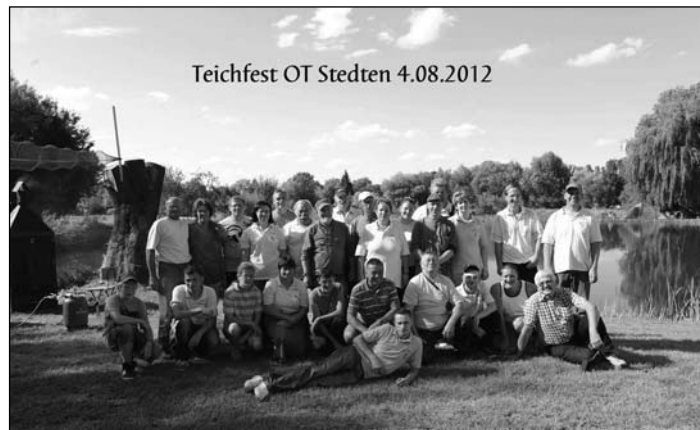
Teichfest OT Stedten 4.08.2012