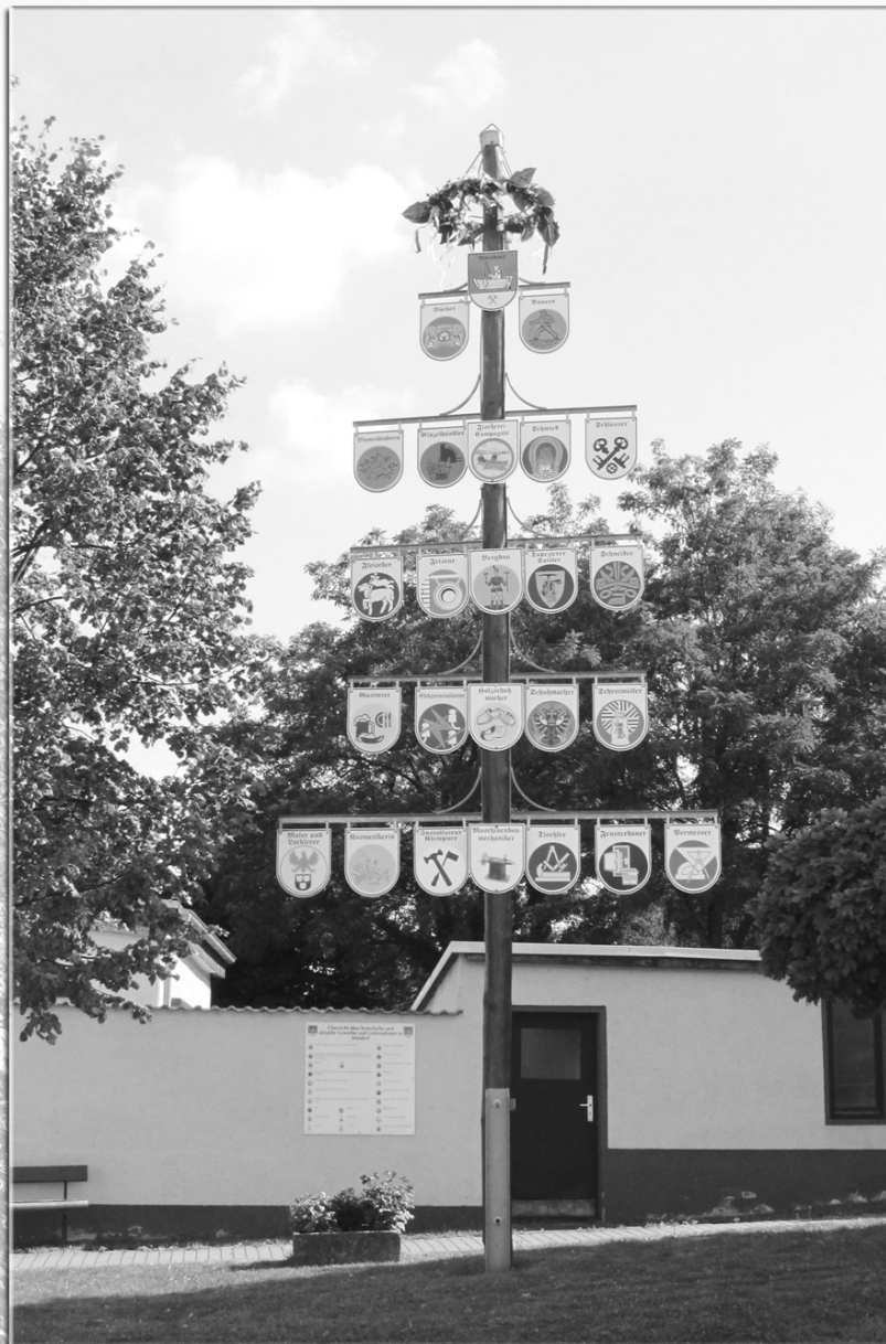
Gewerkebaum im OT Amsdorf