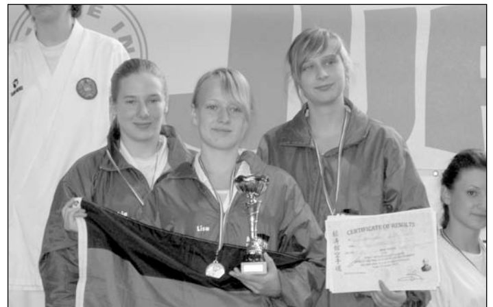
Unsere weiblichen Junioren bei der Siegerehrung.