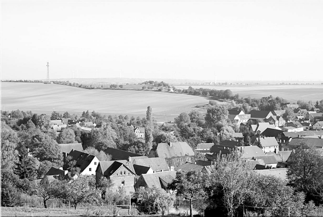
Ansicht OT Hornburg