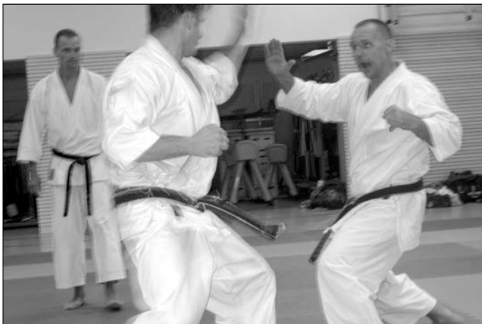
Der Vorstand des BUDO-Verein Kushanku Röblingen e.V.