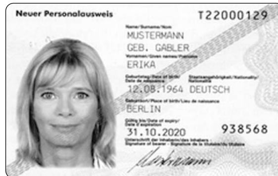
Muster der Vorder- und Rückseite

Er bietet neben der herkömmlichen Nutzung als Sichtausweis zahlreiche neue Funktionen und viele Einsatzmöglichkeiten in der Online-Welt.