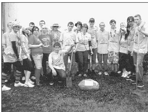
Die Schülervvertreter der Kl. 10R

Im Anschluss pflanzten wir auf dem Schulgelände ein kleines Bäumchen, was vielleicht bis zu unserem ersten Klassentreffen in ein paar Jahren um einige Zentimeter gewachsen ist. Wir würden uns freuen, wenn sich daraus eine Tradition entwickelt, die viele Abschlussklassen nach uns aufgreifen werden.