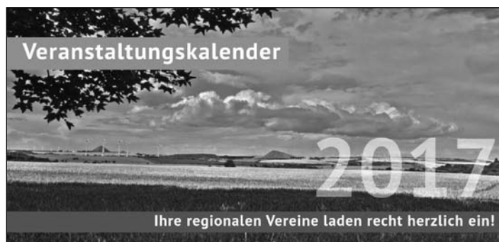
Blick zu den drei Pyramiden

Der Veranstaltungskalender liegt ab sofort im Bahnhof Klostermansfeld in Benndorf und an weiteren gut frequentierten Orten der Region aus und wurde an alle Haushalte der Orte Wimmelburg, Kreisfeld und Hergisdorf verteilt.