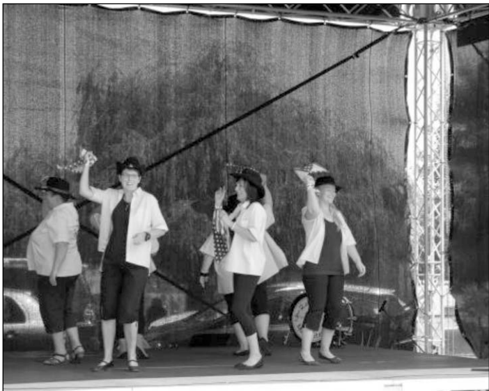
Die Linedancer der Countryfreunde Sweet Lake e.V. aus Erdeborn trugen auch zum Programm bei.

Auf der Bühne standen an diesem Tag auch Mitwirkende aus der Region. So die Linedancer der Countryfreunde Sweet Lake e.V. aus Erdeborn.