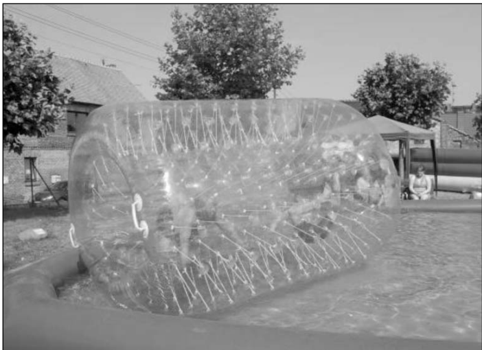
Auch an der Festscheune konnte man sich in einem aufgestellten Pool vergnügen.

Auf der Bühne standen an diesem Tag auch Mitwirkende aus der Region. So die Linedancer der Countryfreunde Sweet Lake e.V. aus Erdeborn.