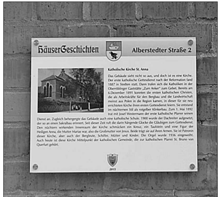
Die dritte Tafel wurde an der katholischen Kirche St. Anna eingeweiht.