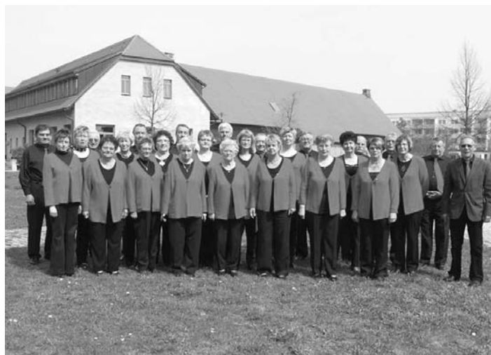
Gemischter Volkschor Ahlsdorf – Foto Reese / OT Erdeborn

Das Konzert wird am 27.4.2014 um 14:30 Uhr in der Klosterkirche Helfta stattfinden.