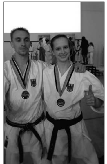
rechts im Bild:

Sie haben Interesse – dann kommen Sie mit Ihrem Kind (oder auch allein) jetzt zu einer „Schnuppereinheit“ zu uns ins Training, immer donnerstags ab 17 Uhr (Kinder) oder ab 18.15 Uhr (Jugendliche und Erwachsene) in die Turnhalle der Grund- und Sekundarschule, Kesselstraße 10 in Röblingen am See.