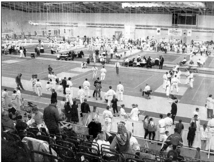
Die Welt zu Gast in Halle

Vielleicht auf ein neues in ein paar Jahren!!!