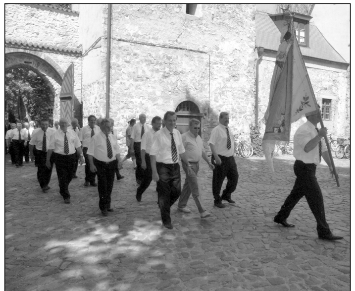
Einmarsch zum Wasserburgfest in Gommern am 5. Juni 2011

Die Teilnahme am Männerchortreffen in Gommern nutzte der Chor zu einem Tagesausflug mit Ehepartnern. Bei besten äußeren Bedingungen traf man gegen mittag in Gommern ein, stattete der aus Erdeborn stammenden Familie Bauerschäfer, die den Auftritt vermittelt hatte, einen kurzen Besuch ab und bereitete sich auf das am Nachmittag stattfindende Chortreffen vor.