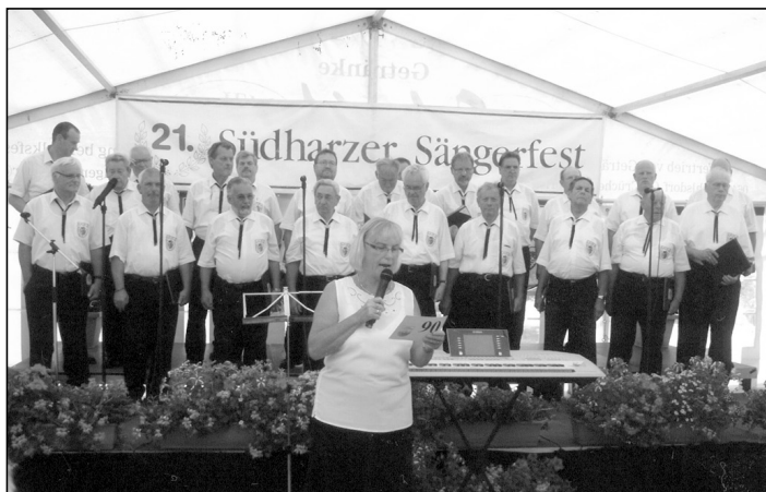
Auf der Bühne beim 21. Südharzer Sängersfest in Heiligenthal.

Die Einladung des Männergesangsvereins Heiligenthal zu ihrem 90-jährigen Jubiläum und gleichzeitig stattfindenden 21. Südharzer Sängersfest hat der Chor gern angenommen.