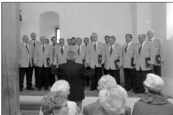
Der Männerchor beim Bursingen in Allstedt

Die Einladung zum Bursingen auf dem Schloss in Allstedt ist für Chöre eine besondere Herausforderung, werden doch vom Veranstalter nur ausgewählte Chöre eingeladen. Die am Nachmittag des 19. Juni stattgefundene Veranstaltung war von ungünstigen Witterungsbedingungen begleitet, so dass die Auftritte der Chöre vom Schlosshof in einen Saal verlegt werden musste. Das störte gar nicht, war doch die Akustik um ein vielfaches besser. Mit viel Schwung und gesanglich anspruchsvollen Liedern zog der Männerchor die zahlreichen Zuhörer in seinen Bann.