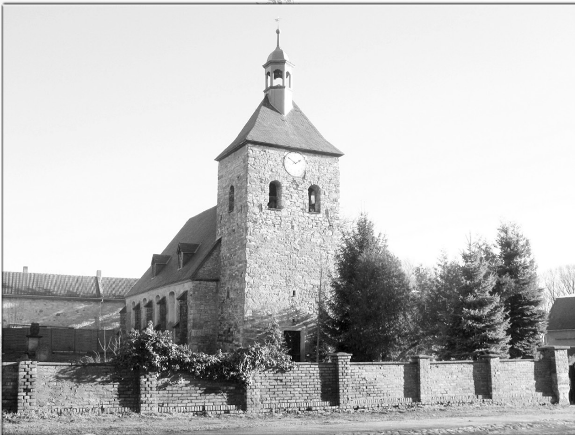
Kirche St. Susanna - Dederstedt -